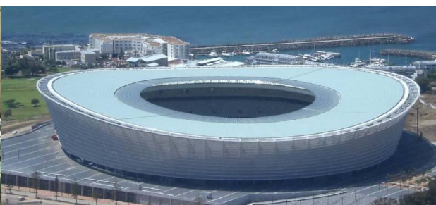
Greenpoint Stadion in Kapstadt