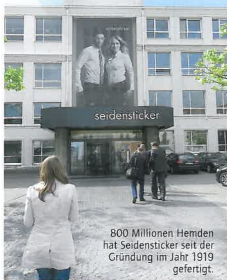
800 Millionen Hemden hat Seidensticker seit der Gründung im Jahr 1919 gefertigt.