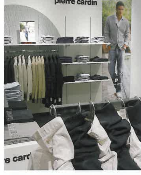
Die Marke Pierre Cardin ist einer der Umsatzbringer bei Ahlers aus dem Premiumsegment.