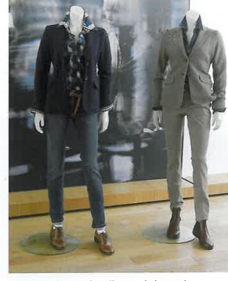
Brax versteht es, aktuelle Trends in tragbare Mode umzusetzen.

Die Erfolgsgeschichte der Gerry Weber International AG vom Jahr 1973 bis heute lässt sich mit beeindruckenden Zahlen untermauern: Der Umsatz betrug im vergangenen Geschäftsjahr 621,9 Millionen Euro, erwirtschaftet von mehr als 2.700 Mitarbeitern weltweit. Für 2010/2011 rechnet man mit